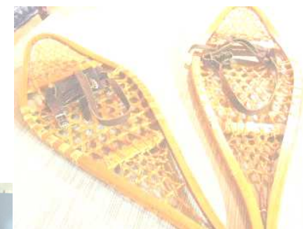
Raquettes à neige